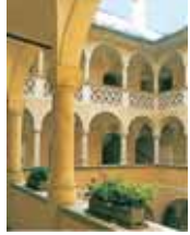
20. Notranje dvorišče, stara mestna hiša

18 Stara mestna hiša Spanski gradbeni mojster jo je zgradil okoli 1600. Nekoč palača Welzer, danes palača Rosenberg. Zanimivo so arkadno dvorišče in grb Rosenbergov nad glavnim portalom ter Fromillerjeva slika Justicije z grbom mesta in dežele.