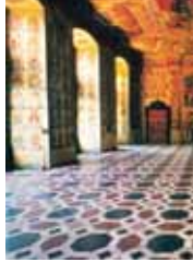
9 Landhaus/Deželna hiša (dvorana grobov) Slika baročnega slikarja Fromillerja

4 Cona za pešce Kramerger Prva cona za pešce v Avstriji (od 1961) in poleg Starega trga in Dunajske ceste (Wiener Gasse) najstarejša celovška ulica. Del križišča prometnic vzhod-zahod in sever-jug, kamor je vojvoda Bernhard sredi 13. stoletja prestavil tržnico z vnožja Spitalberga. Zanimivo so hiše št. 3 (arkadno dvorišče), 6, 7, 8, 9, 9a (rekonstruirana baročna fasada) in 11, vse v secesijskem slogu.