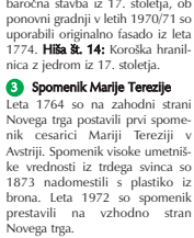
3. Spomenik Marije Terezije

3 Spomenik Marije Terezije Leta 1764 so na zahodni strani Novega trga postavili prvi spomenik cesarici Mariji Tereziji v Avstriji. Spomenik visoke umetniške vrednosti iz trdega svinca so 1873 nadomestili s plastiko iz bronca. Leta 1972 so spomenik prestavili na vzhodno stran Novega trga.