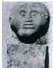
22. Pekovski javence

22 Pekovski javence Pripovedka o imenu: Zaradi domnevne tatvine so nekoč ustnili pekovega javenca, za katerega se je pozneje izkazalo, da je bil neodožen. Meščani so nato sklenili, vsi na kraj imenjuje Klagenfurt v spomin na svarilo.