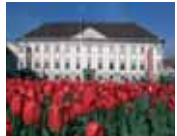
1. Celovška mestna hiša

1 Mestna hiša Ima to funkcijo od leta 1918. Renesančna palača grofov Rosenberga z zanimivim stopničjem je bila zgrajena leta 1650.