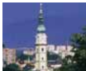
18. Mestna župna cerkev z zvončki Možen ogled!