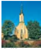
1. Chiesa di S. Giovanni

1 Partendo dall'Elisabethsteg si attraversa la Martin-Luther-Platz con la chiesa evangelica di S. Giovanni (costruita tra il 1884 e il 1886) e la Lerchenfelderstraße/Henkelstraße, per giungere ad una delle tappe più importanti dell'itinerario.