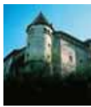
20. Castello Hallegg

Partendo dall'Elisabethsteg si prosegue lungo la Tarviser Straße, e desce del Minimundus e dell'Europapark fino alla spagata Metzgerstrand. Arrivati alla spagata Friedstrand si prosegue fino al primo sottopassaggio ferroviario, dal quale si raggiunge la Villacher Straße. Qui si gira a sinistra e dopo 800 m circa si gira a destra nella Jenovitschstraße. Dopo altri 500 m, passando sotto la nova autostrada, si giunge alla Hallegger Straße. Lungo questa strada si costeggia i laghetti Hallegger Teichen per arrivare al